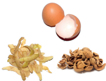
Préparations de repas