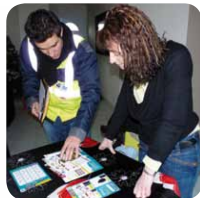
> Des outils pratiques et ludiques