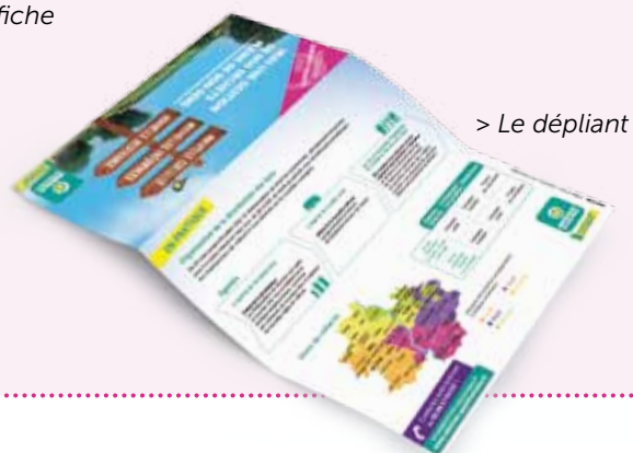
> Le dépliant