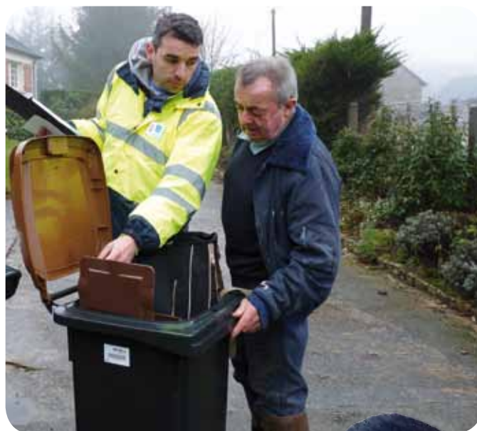
> Des Ambassadeurs pédagogiques et à l'écoute