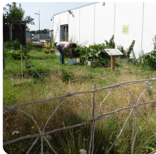
Jardin terminé - Août 2021