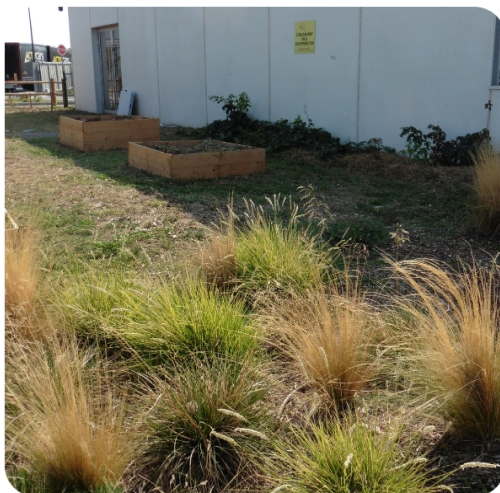
Encours de construction - Août 2020