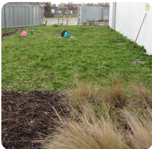
Début du chantier - Janvier 2020